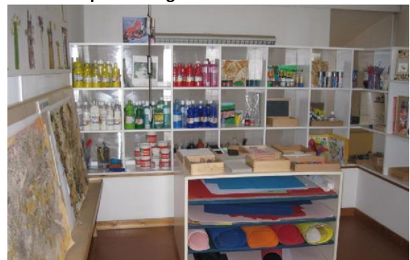
Compacte creatieve hoek met materiaal op kindhoogte