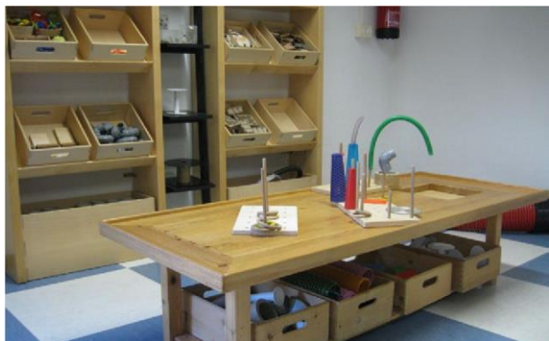
Área tòf di trabou ku materialnan berdadero