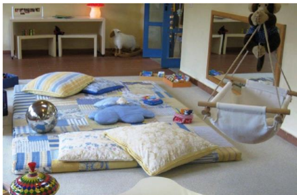
Área di bebi