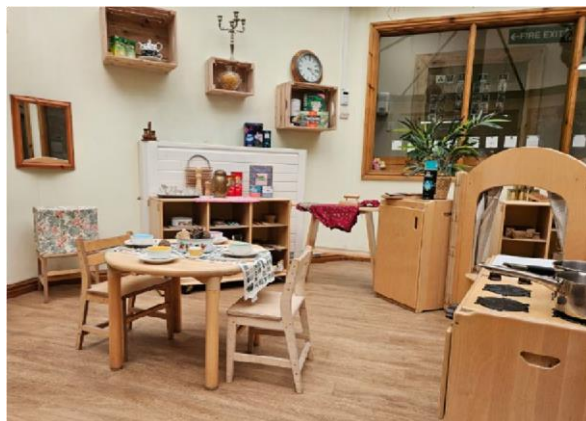
Skina di kas