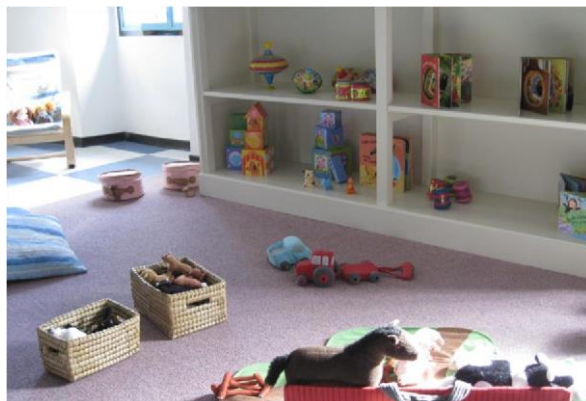
Material na altura di mucha