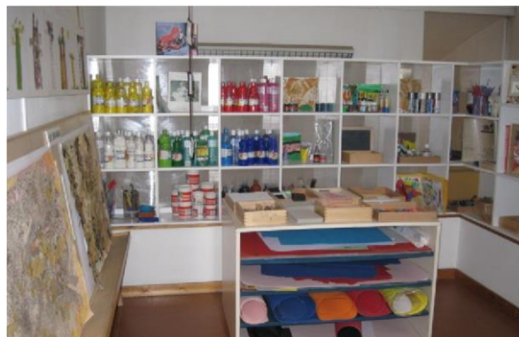
Skina kreativo kompakto ku material na altura di mucha