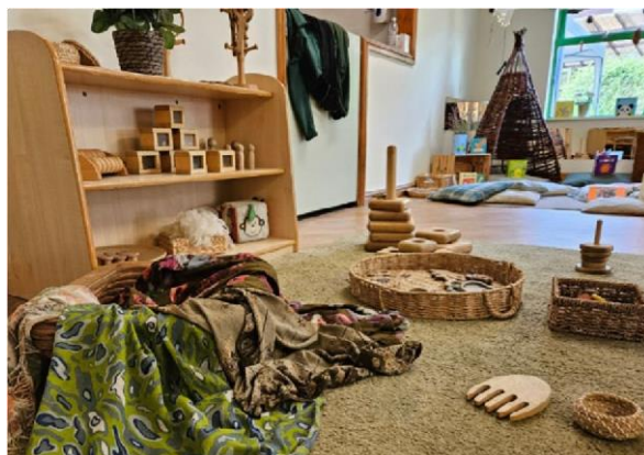
Área di deskubrí