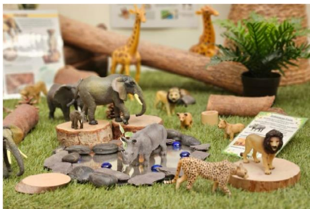
Área di tema