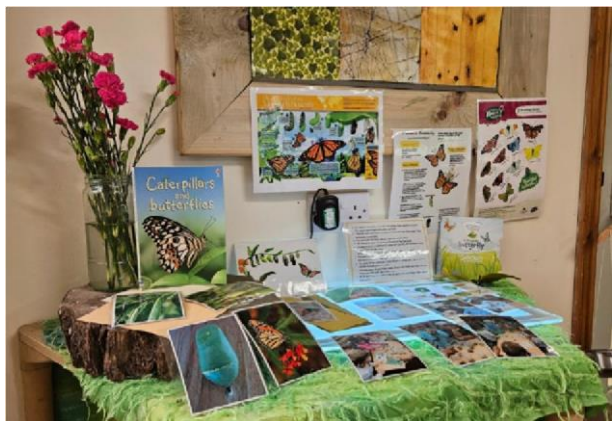
Área di tema