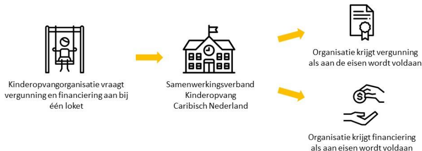
Figuur 1: Samenwerking Rijk en openbare lichamen

De financiering is gebaseerd op drie belangrijke pijlers: (1) de Rijksoverheid bekostigt kindercentra en gastouders rechtstreeks; (2) er wordt gebruik gemaakt van actuele gegevens over het gebruik van de kinderopvang; en (3) ouders betalen een ouderbijdrage waarvan de hoogte afhangt van hun vastgestelde inkomen. In Figuur 2 is dit systeem op hoofdlijnen weergegeven.