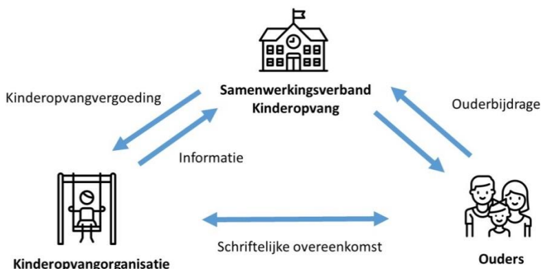
Figuur 2: Stelsel financiering op hoofdlijnen

De financiering is gebaseerd op drie belangrijke pijlers: (1) de Rijksoverheid bekostigt kindercentra en gastouders rechtstreeks; (2) er wordt gebruik gemaakt van actuele gegevens over het gebruik van de kinderopvang; en (3) ouders betalen een ouderbijdrage waarvan de hoogte afhangt van hun vastgestelde inkomen. In Figuur 2 is dit systeem op hoofdlijnen weergegeven.